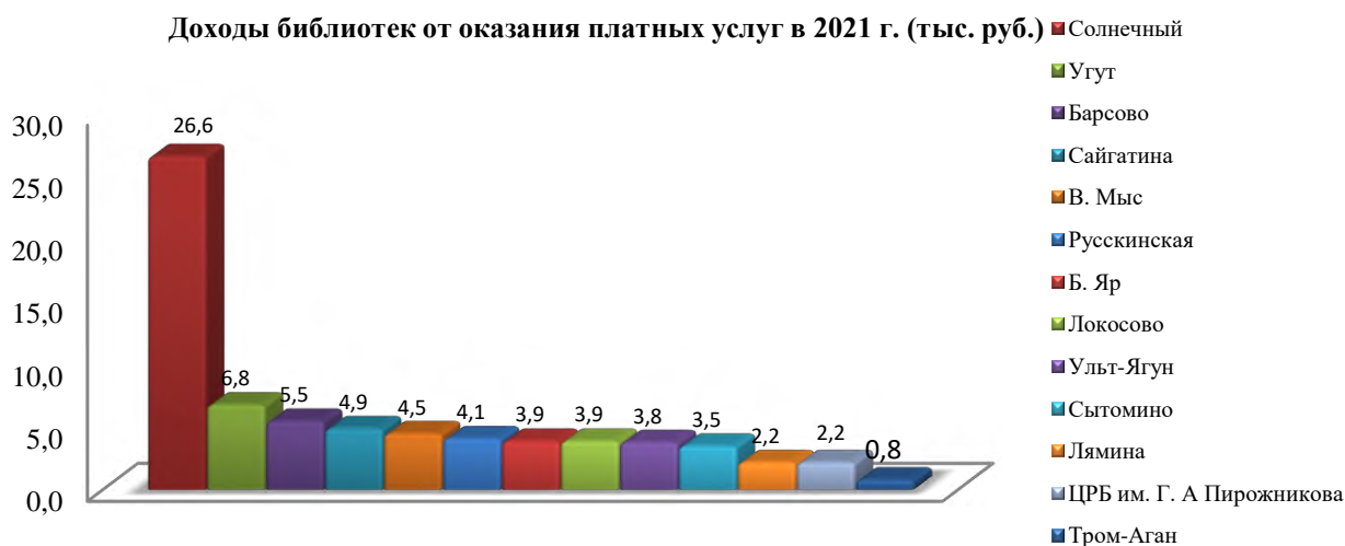
Рейтинг дополнительных платных услуг по видам

В 2021 г. библиотеками Учреждения получено 74,4 (+62,5) тыс. рублей.