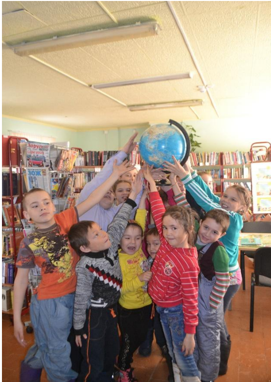
«День Земли» Тром-Аганская библиотека