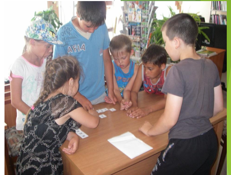
«Щебечут птичьи голоса» Высокомысовская МБ им. В. П. Замятина