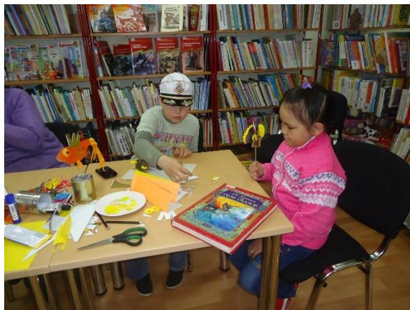
Угутская библиотека Работа над поделкой