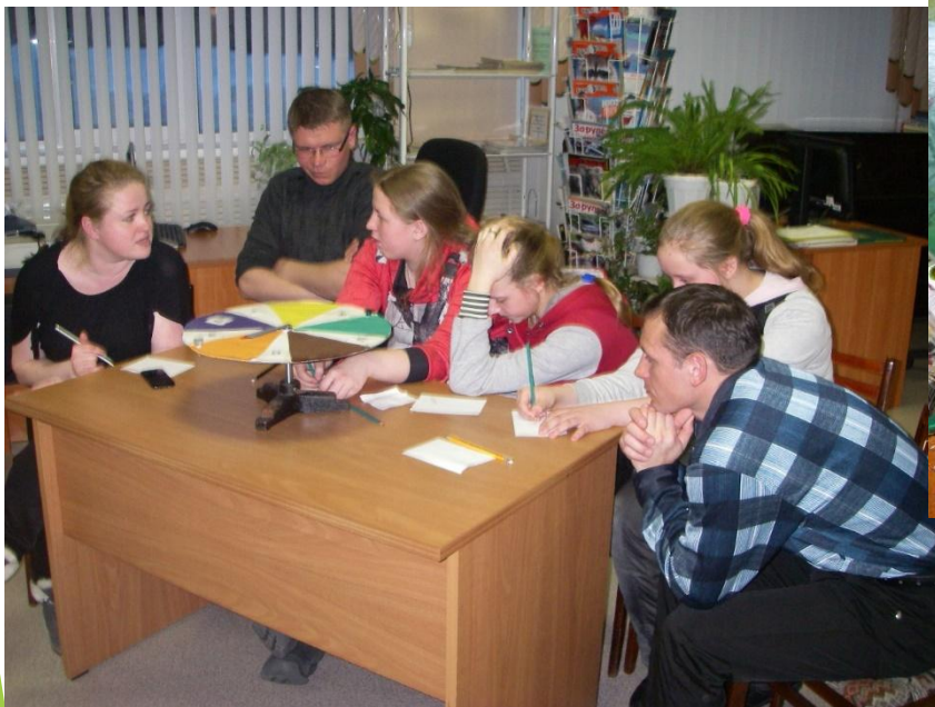
Интеллектуальная игра «Что? Где? Когда?» «Диалог с живой природой» Высокомысовская МБ им. В. П. Замятина