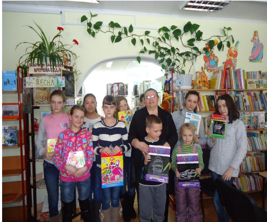
«День природы» Угутская библиотека