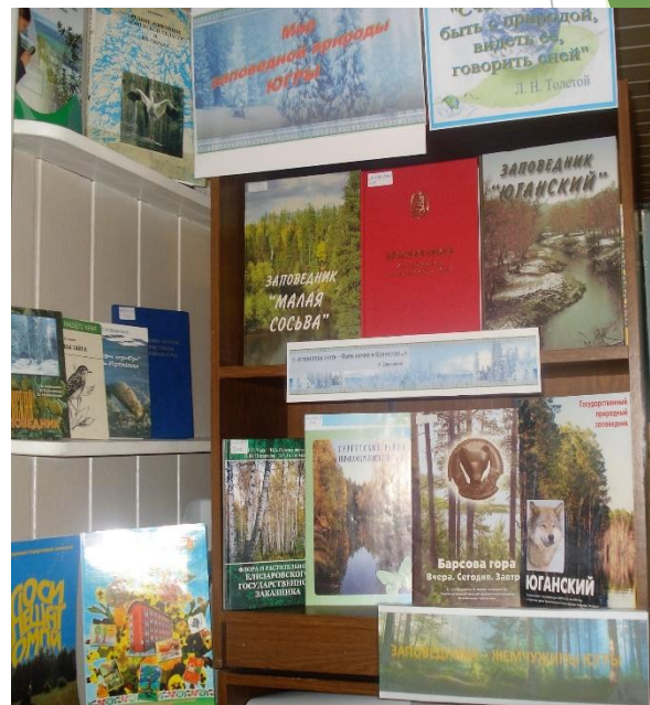
«Мир заповедной природы» Сайгатинская библиотека