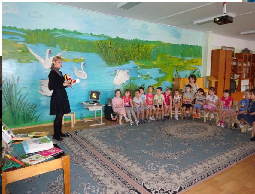
Белоярская детская библиотека