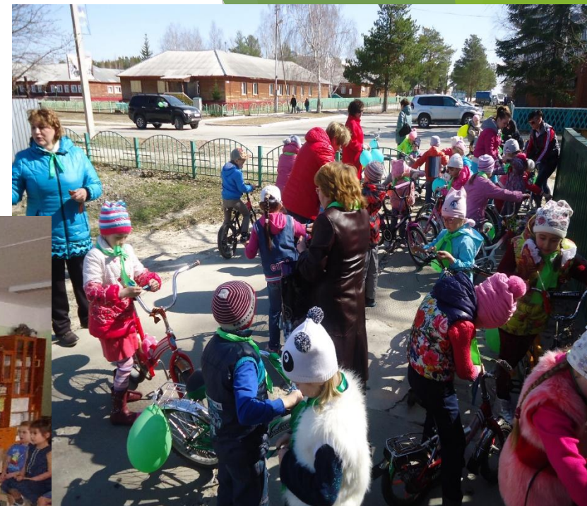
Участники велопробега с. п. Угут