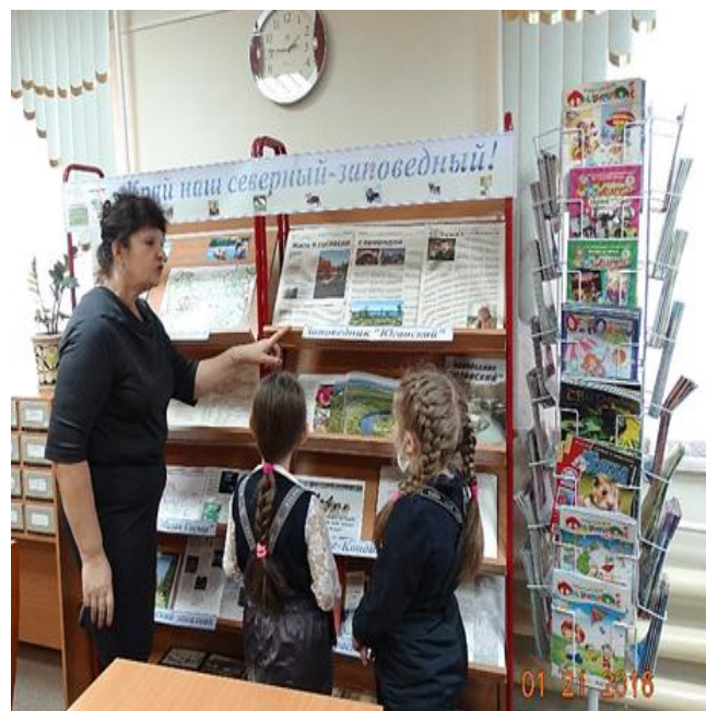
«Край наш северный - заповедный!» Солнечная модельная библиотека