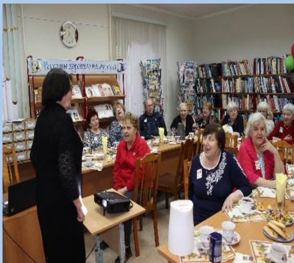
Литературно-музыкальная композиция «Меня поэтом сделала война»