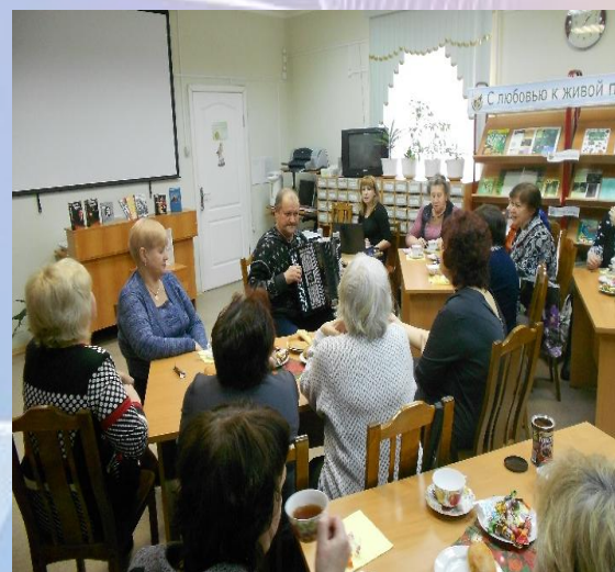
Музыкально-поэтический час «Носил он совесть ближе к сердцу»