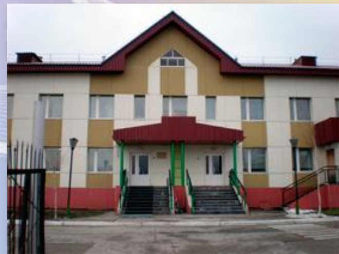
Солнечная коррекционная школа-интернат