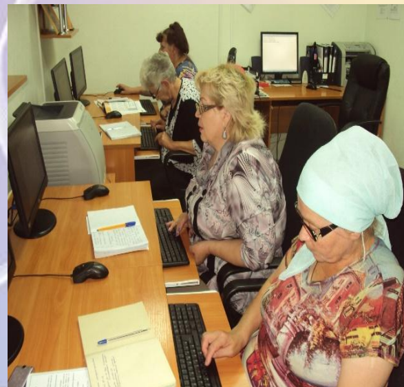
Познавательная беседа «Сайт государственных услуг – надёжный помощник и друг»