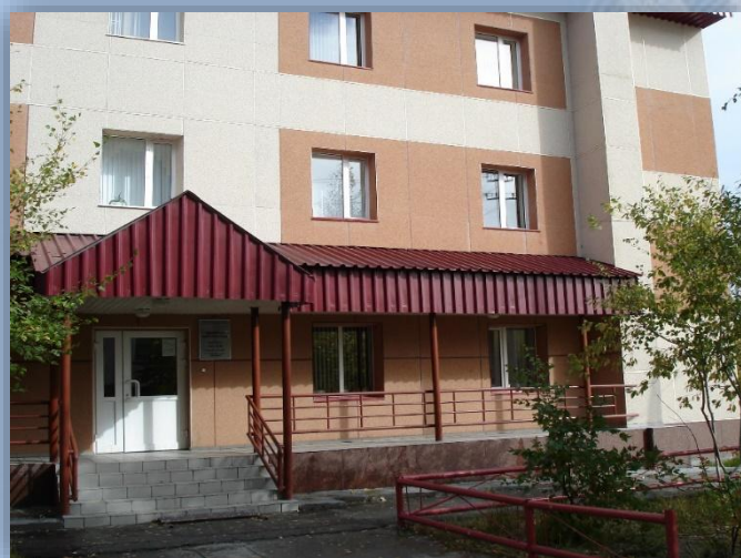
Солнечная модельная библиотека

На протяжении нескольких лет нашим социальным партнёром является расположенная на территории посёлка коррекционная школа-интернат