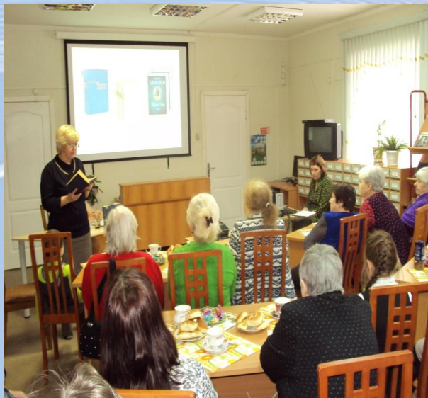
Литературная гостиная «Тихий Дон – казачья слава»